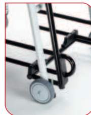
Um das Hinsetzen und Aufstehen zu erleichtern, sind die Arm- und Fußstützen hochklappbar.