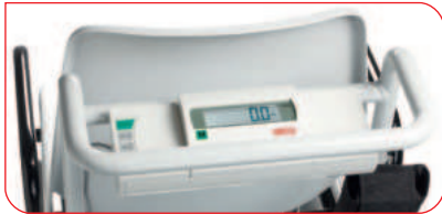
Das Display ist praktisch positioniert und lässt sich leicht bedienen.

Da sich der Nullpunkt der Wiegefunktion – gerade bei einer hochsensiblen Waage – durch äußere Einflüsse verändern kann, wird er automatisch von der Elektronik jede Sekunde geprüft und angepasst. Und damit die seca 959 auch das Gewicht unruhiger Patienten präzise anzeigt, besitzt sie eine wirkungsvolle Dämpfung. Eine zusätzliche Funktion: Per Knopfdruck lässt sich bei der seca 959 automatisch der BMI-Wert und damit der Ernährungszustand der gewogenen Person ermitteln. Und mit ihrer feinen Teilung von 50 g bis 150 kg ist sie speziell für die Kinder- und Jugendmedizin ausgesprochen wertvoll.