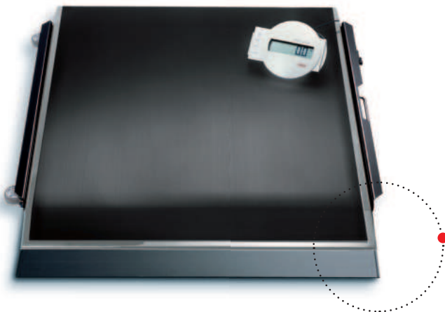
Im Lieferumfang ist eine Rampe zum leichten Auffahren von Rollstühlen enthalten.