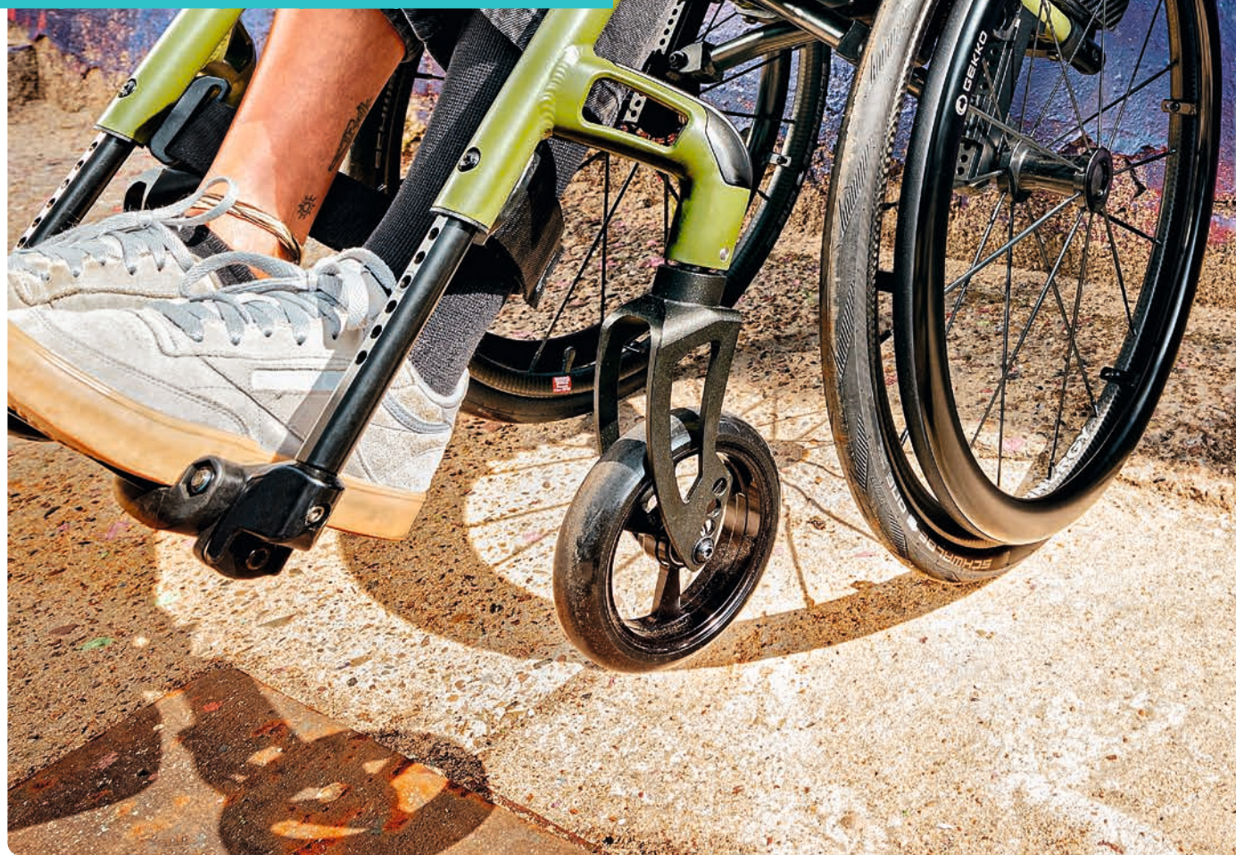
ABB.: NANO X AB SEITE 29

Die innovative Doppelkreuzstrebe in Sandwichbauweise bietet beste Falt- und Fahrperformance. Selbst unwegsames Gelände stellt den Faltrollstuhl NANO X vor keine Herausforderung, denn diese Bauweise macht ihn enorm stabil bei geringem Gewicht.