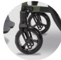
Einfache und präzise Nachstellung der Laufrichtung für gerades Fahren