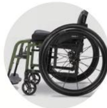
Minimal sichtbarer Rahmen