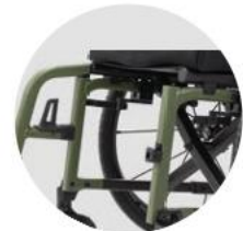
Rahmenhöhe auf Beinstützen abgestimmt