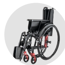
Sehr schmales Faltmaß: Breite ab 280 mm; Höhe ab 470 mm (kurzer Rahmen)