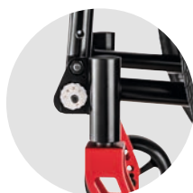
Perfekt angepasst durch die Exzenter-Steuerkopf-Verstellung