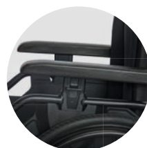
Höhenverstellbares Seitenteil mit Einhandbedienung (optional)