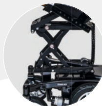
Elektrische Sitzkantelung mit optionalem Scherenlift 300 mm