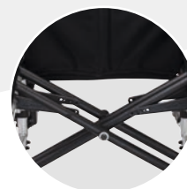
Doppelschere in Serie