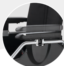
Höhenverstellbares Seitenteil mit tiefeinstellbarer Armauflage