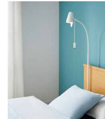
▲ Leselampen lassen sich in die Aufnahmehülse stecken oder am Aufrichter befestigen.