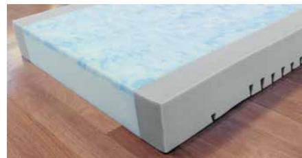
▲ Modell Sky-fit mit hochwertiger Skytherm®-Auflage.

Verbringen Bewohner viel Zeit im Bett, bieten Original-Burmeier-Matratze eine ideale Kombination aus Komfort und Prävention. Sie sind genau auf die Aufteilung der Liegefläche abgestimmt und machen jede Bewegung mit. Bei Verstellung der Rücken- und Oberschenkellehnen sorgen sie so für ideale Druckentlastung. Die Modelle Sky-fit und Comfort-fit sind zudem Wendematratzen mit einer glatten und einer eingeschnittenen Seite. Dadurch sind diese Matratzen niemals „zu hart“ oder „zu weich“ – sie lassen sich einfach umdrehen und bieten zwei verschiedene Liegegefühle.