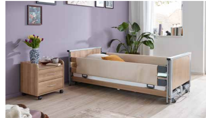
▲ Schaumlederbezüge schützen vor Stößen gegen die Seitensicherungen.