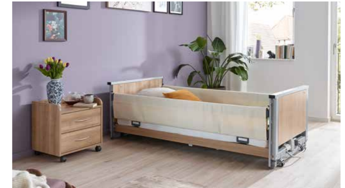
▲ Textile Sofcover verkleiden die Seitensicherung in attraktiven Farben – hier Vanilla.