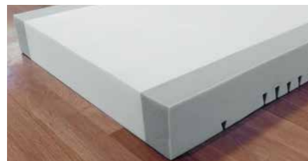
▲ Modell Comfort-fit mit Randzonenverstärkung.