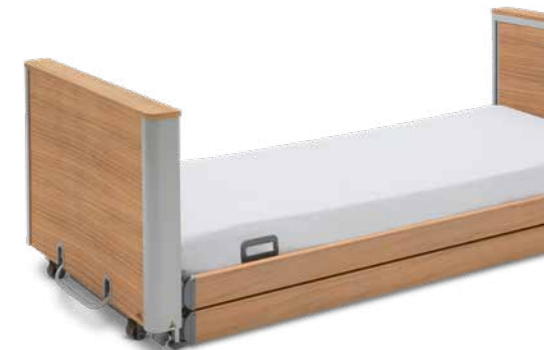
▲ Holzhauben verkleiden wohnlich die Kopf- und Fußteile.

Für maximales Wohlbefinden empfehlen wir die Komfortliegefläche aus 50 freischwingenden Elementen.