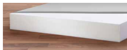
▲ Modell Basic-fit.