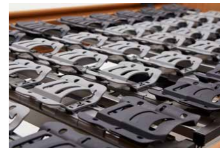
▲ Die Komfortliegefläche sorgt mit 50 freischwingenden Elementen für einen idealen Druckausgleich.