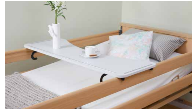
▲ Das praktische Serviertablett für genussvolle Mahlzeiten.