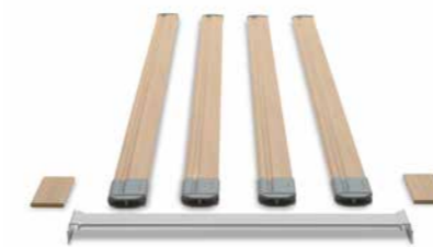
▲ Mit dem Verlängerungs-Set lässt sich die integrierte Bettverlängerung optimal nutzen.

Mit Original-Zubehör von Burmeier wird das Lenus zu einem Bett, das keinen Wunsch offenlässt. Bereits integriert ist eine ausziehbare Verlängerung des Bettrahmens um 20 cm. Zu ihrer Nutzung steht ein Verlängerungs-Set mit einem Ergänzungsstück für die Liegefläche, längeren Seitensicherungsholmen und Füllstücken für die Seitenblenden zur Auswahl. Auch ein passendes Polsterteil zur Verlängerung der Matratze ist erhältlich. Leselampe und Unterbettlicht sorgen für angenehmes Licht und sichere Orientierung bei Nacht. Unruhige Bewohner schützt der Schaumlederbezug vor Stößen gegen die Seitensicherung. Ein praktisches Serviertablett für Mahlzeiten wird einfach auf die Seitensicherung gelegt.