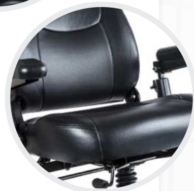
Gefedertes Komfort-Sitzsystem, große Beinfreiheit und stufenlose Sitzverstellung