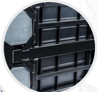
Äußerst robuster Kassettenrahmen