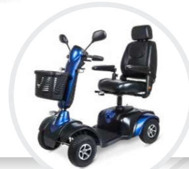
Modernes Design mit gefälligen Formen in Trendfarben