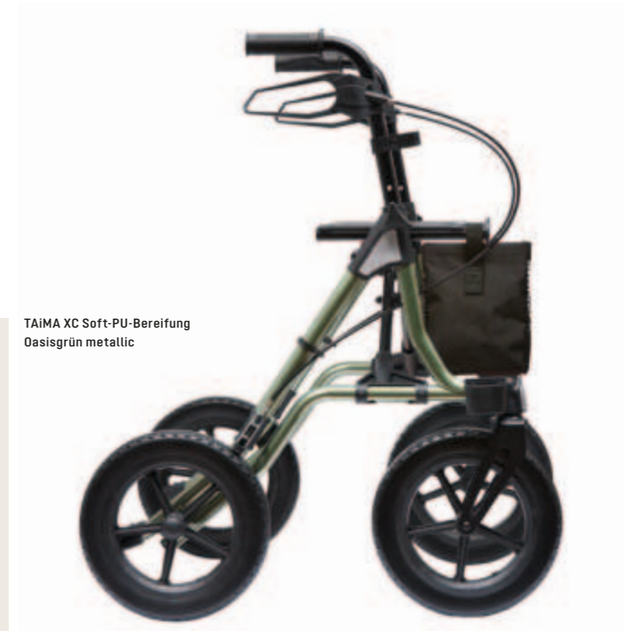
TAiMA XC Soft-PU-Bereifung Oasisgrün metallic

In die Radgabel integrierte Lenkungsdämpfer unterstützen den ruhigen Geradeauslauf der beiden Vorderräder.