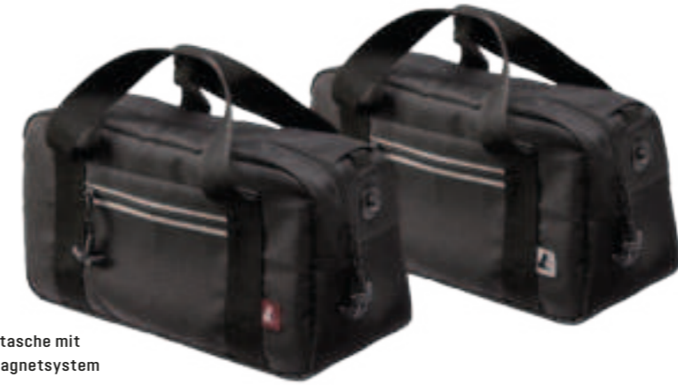
Premiumtasche mit Fitlock Magnetsystem