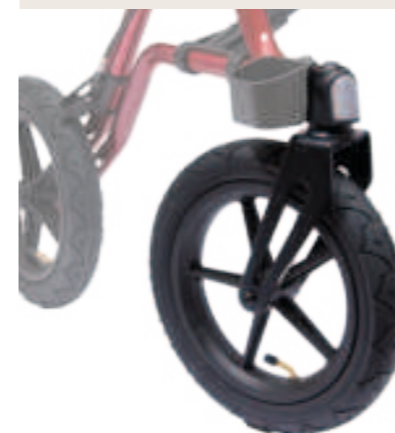
TAiMA XC Luftbereifung Rot metallic

Hochwertige Reflektoren an allen Seiten erhöhen die Sicherheit bei einsetzender Dunkelheit.