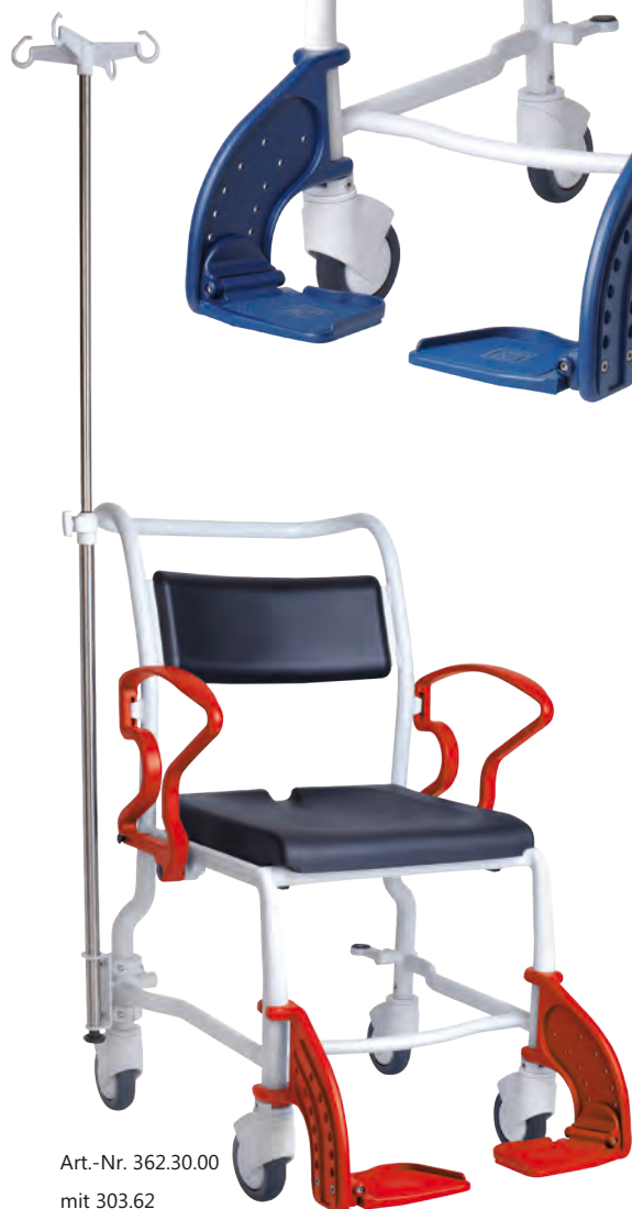
Art.-Nr. 362.30.00 mit 303.62