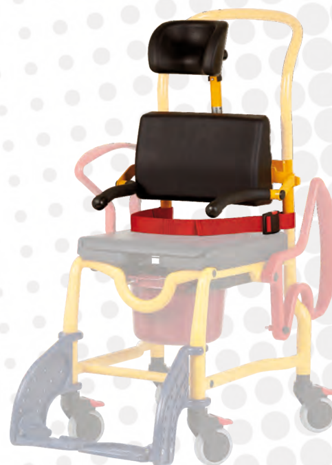
Art.-Nr. 339.04.97 Abb. mit Kopfstütze mit Sitzbreiten- und Tiefenanpassung